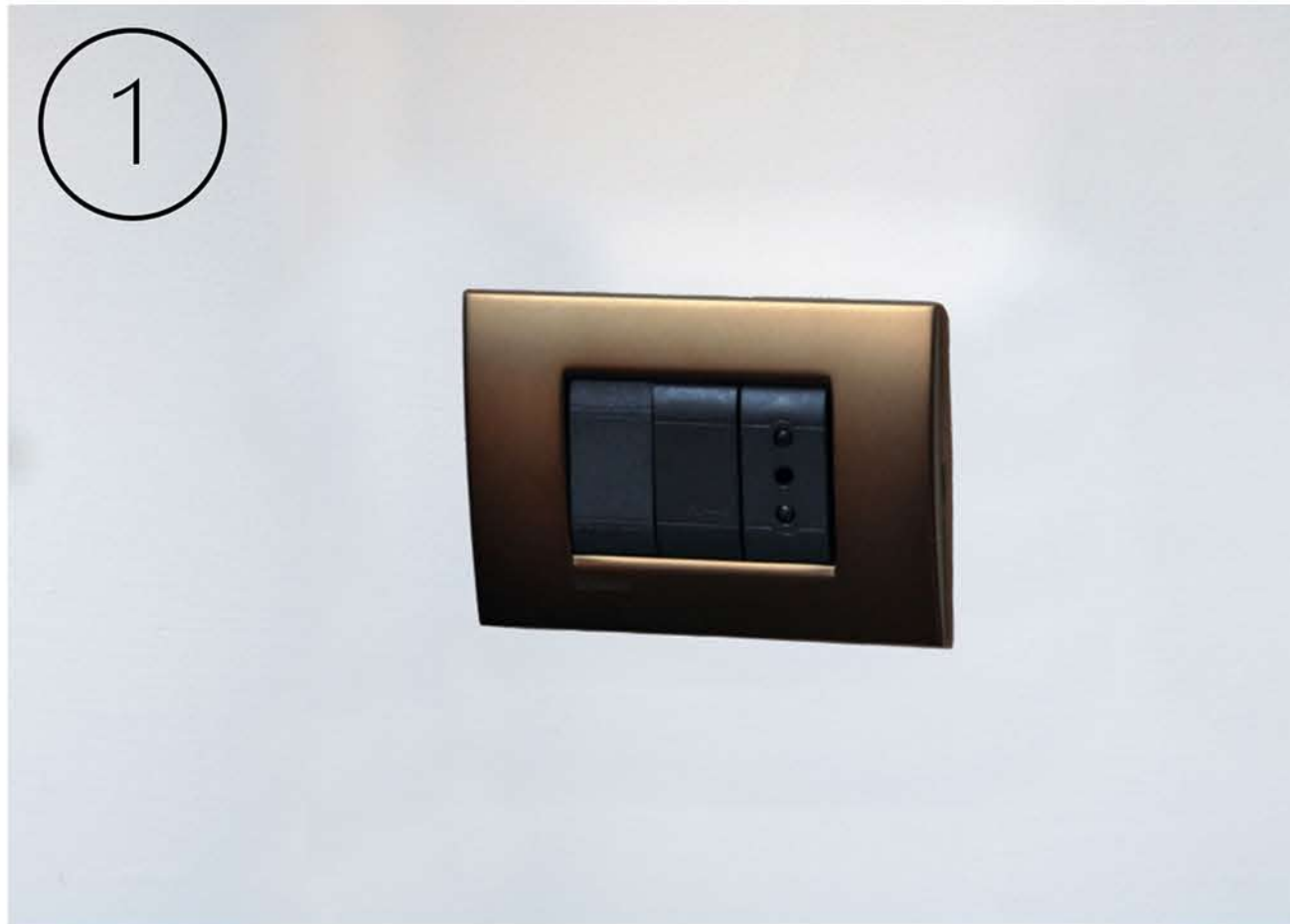
Rimuovere la cornice dal telaio