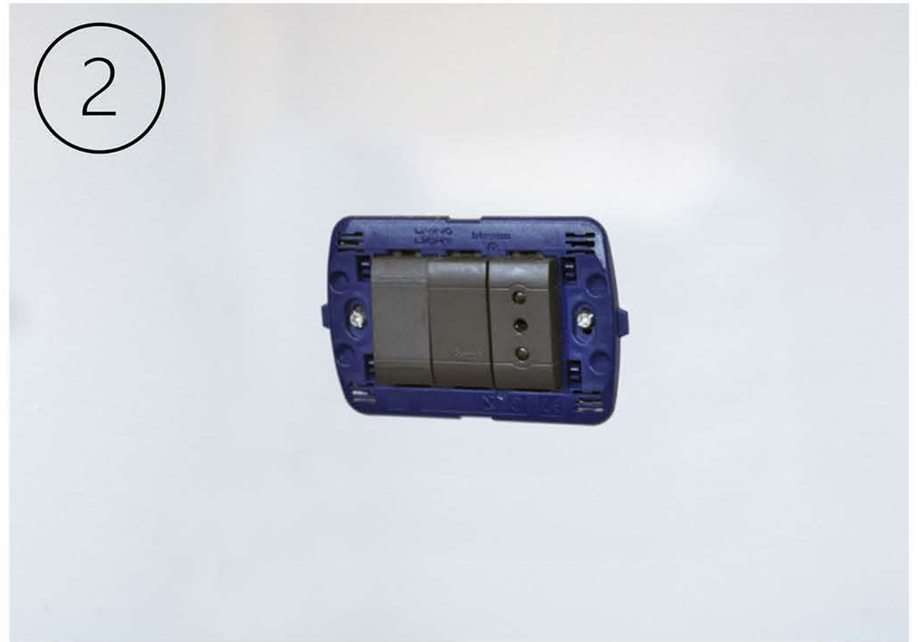
Svitare le viti di 2mm e allentare il telaio